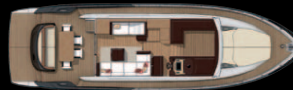
MAIN DECK VERSION WITH BAR