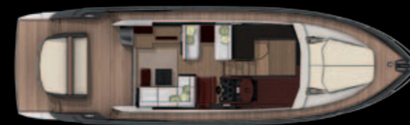
MAIN DECK VERSION WITHOUT BAR