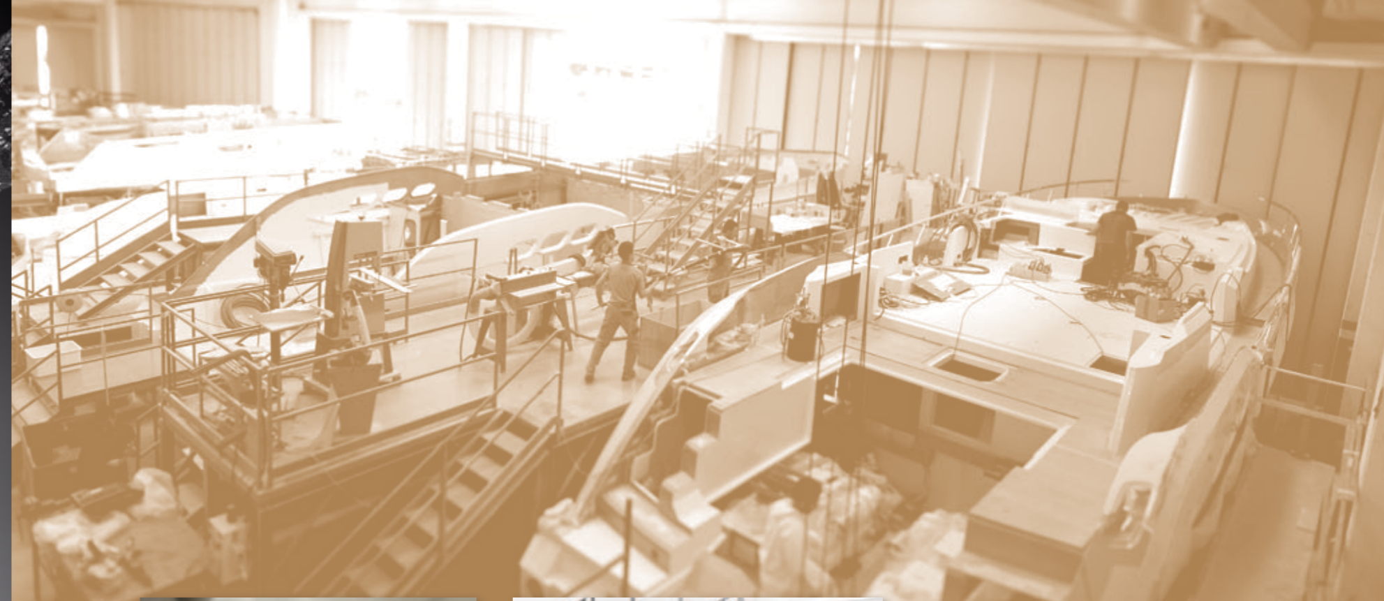
Advertising campaign for SESSA Motoscafo AXEL, in 1982